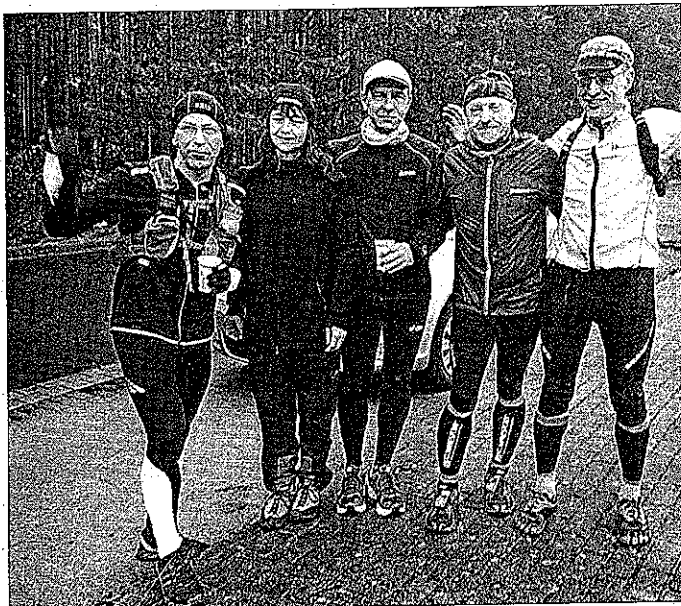
Die Teilnehmer am 66-Seen-Lauf

Warum in die Ferne schweifen, wenn wunderbare Landschaftsläufe nicht weit vom heimischen Peitz entfernt stattfinden. Ein alter bekannter, in der Vergangenheit vom T-Rex-Team schon oft besuchter Lauf, ist der Schlaubetal-Marathon mit Start und Ziel in Eisenhüttenstadt.